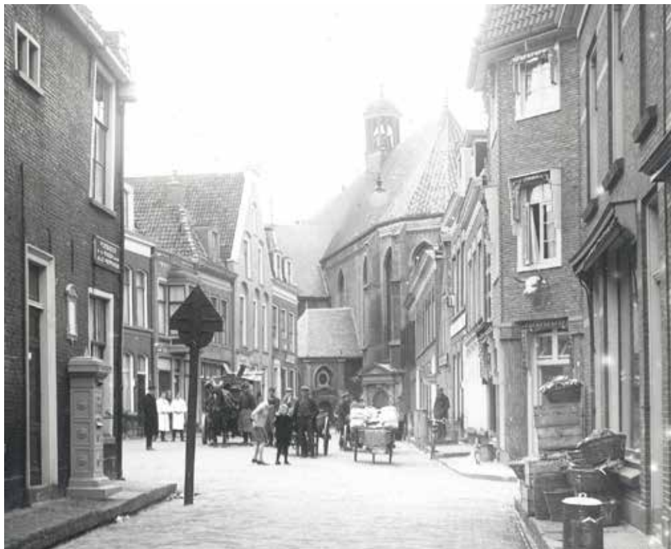
Gezicht op de oude joodse buurt. Bij de Put, eind jaren dertig.

De werkgroep Open Joodse Huizen Leeuwarden bestaat uit vertegenwoordigers van Fries Verzetmuseum, Tûmba, Tresoar, Aed Levwerd, werkgroep Speelmankwartier en het Historisch Centrum Leeuwarden (HCL). Open Joodse Huizen Leeuwarden wordt mede ondersteund door tal van vrijwilligers. Tevens met dank aan alle locaties, sprekers en anderen.