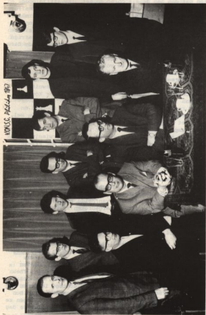
Philidor Kampioen van Nederland 1966-1967.