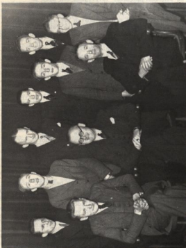
Philidor kampioen van de 1e klasse C in 1949.

Met angst en beven is de mogelijkheid van Walings overlijden al eens eerder geopperd. Het begon al in 1965 toen hem (op weg naar het Hoogovenstoernooi) een ernstig auto-ongeluk overkwam, dat hem een zware handicap aan zijn been bezorgde, waardoor hij moeite kreeg met lopen. Dit moet voor een zo sportief ingestelde man zwaar te dragen zijn geweest. Maar hij droeg deze last met humor en gelatenheid, ik heb er hem nooit over horen klagen. Ook later heeft hij nog verschillende operaties ondergaan, die gevolgd werden door een glorieus rentree in het strijdperk, waarbij hij steeds verzekerde dat hij "ijzersterk" was teruggekomen. Allengs kreeg hij de schijn van onverwoestbaarheid en wij hoopten dat hij de leeftijd der zeer sterken wel zou halen. Het heeft niet zo mogen zijn. De trieste mare, dat de levensklok van Waling voorgoed tot stilstand was gekomen, heeft onze harten vervuld met verbijstering en verslagenheid en vervolgens met weemoed en berusting. Geconfronteerd met de harde realiteit van zijn dood, rest ons niet anders dan een respectvol en dankbaar gedenken van Walings leven en werk. Het is goed, dat dit in een speciaal aan hem gewijd memorandum kan gebeuren. Want de herinnering aan deze unieke schaakvriend mag niet vervagen.