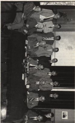
Het kampioenschap van Nederland, Leeuwarden 1942.