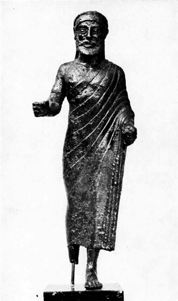
fig. 1. Zeus (eind 6 e eeuw v, Chr ) Athene, Nat. Museum