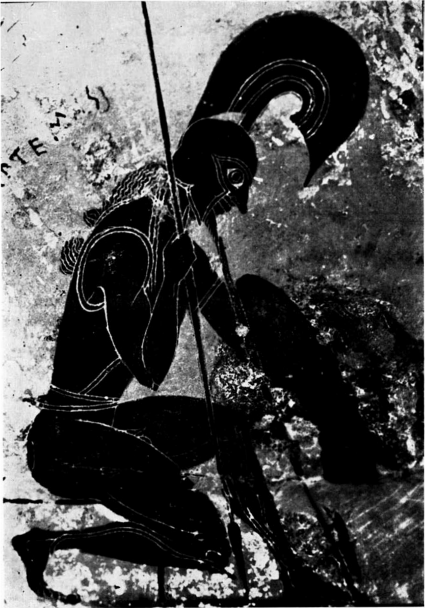
fig. 6. ARES (1 e helft 6 e eeuw v. Chr.) Florence , Museo Archeologico