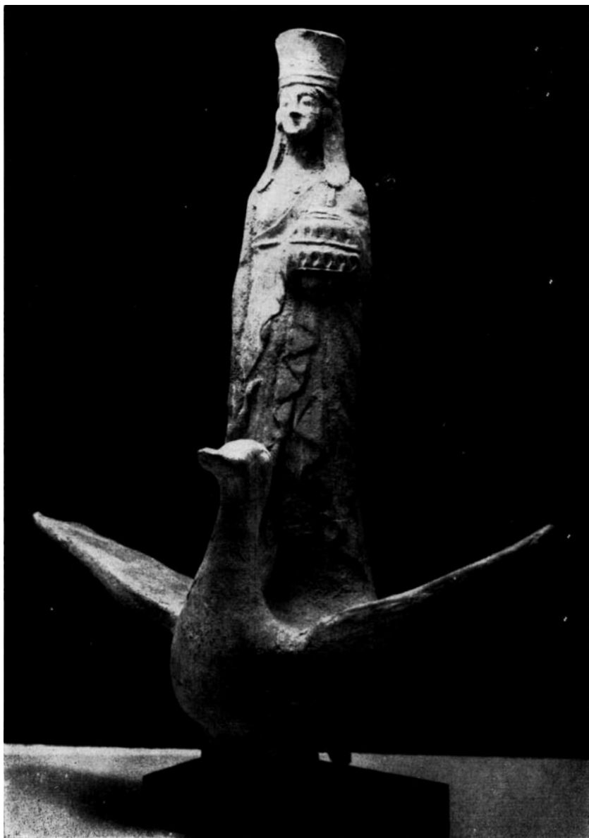
fig. 5. APHRODITE (5 e eeuw v. Chr.) Parijs, Louvre