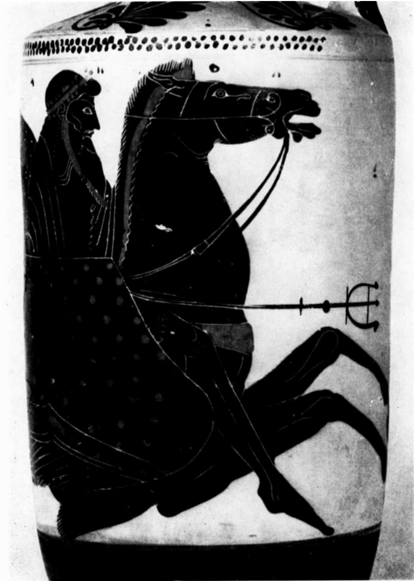
fig. 3. POSEIDON (begin 5 e eeuw v. Chr.) Oxford , Ashmolean Museum