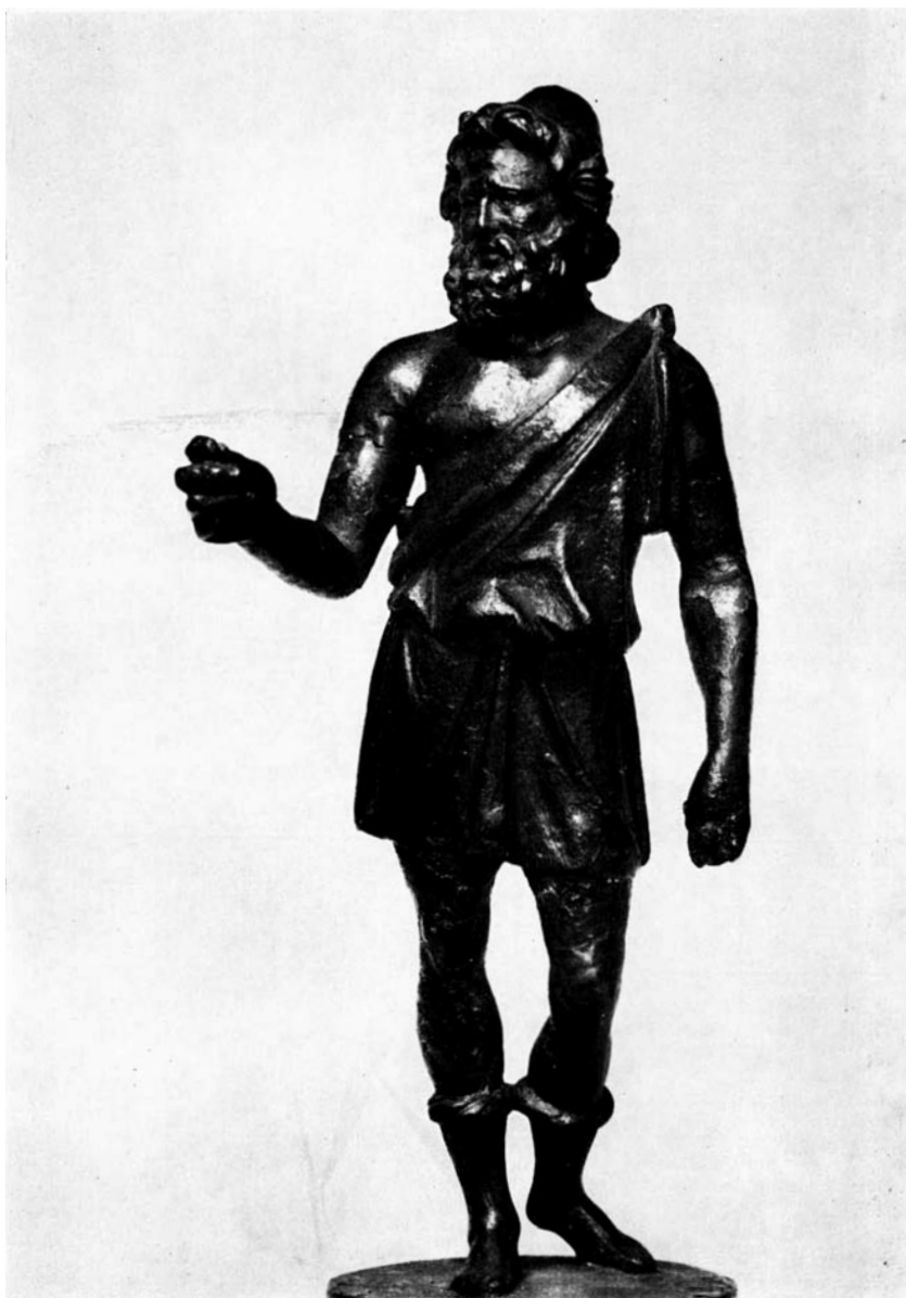
fig. 7. HEPHAISTOS (eind 3 e eeuw v. Chr.) Londen , British Museum