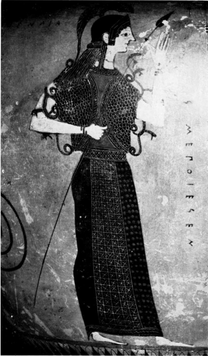
fig. 4. PALLAS ATHENA (2 e helft 6 e eeuw v. Chr ) Parijs , Louvre