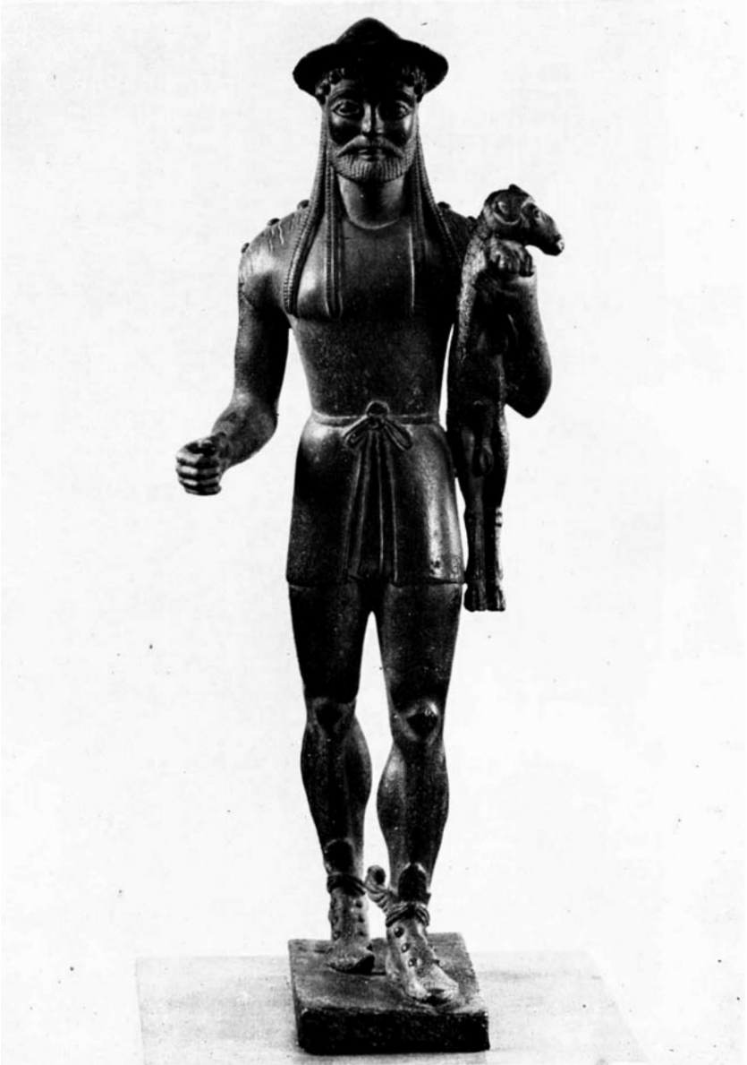
fig. 2. HERMES (eind 6 e eeuw v. Chr ) Boston , Museum of Fine Arts