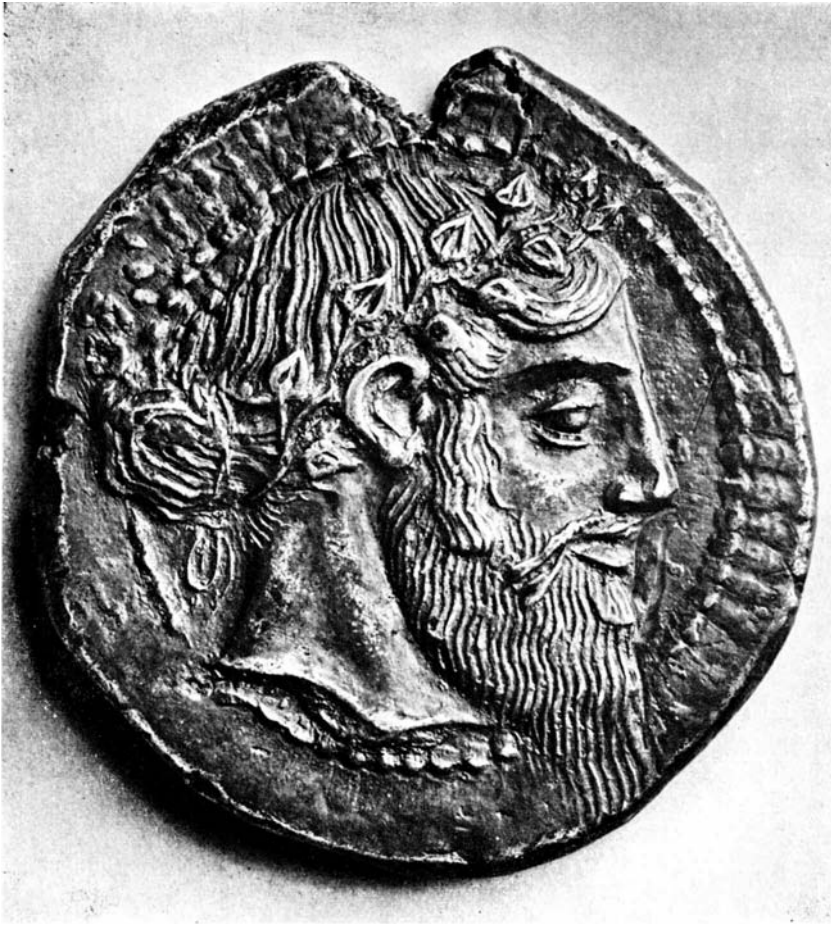
fig. 9. DIONYSOS (munt Naxos midden 5 e eeuw v. Chr)