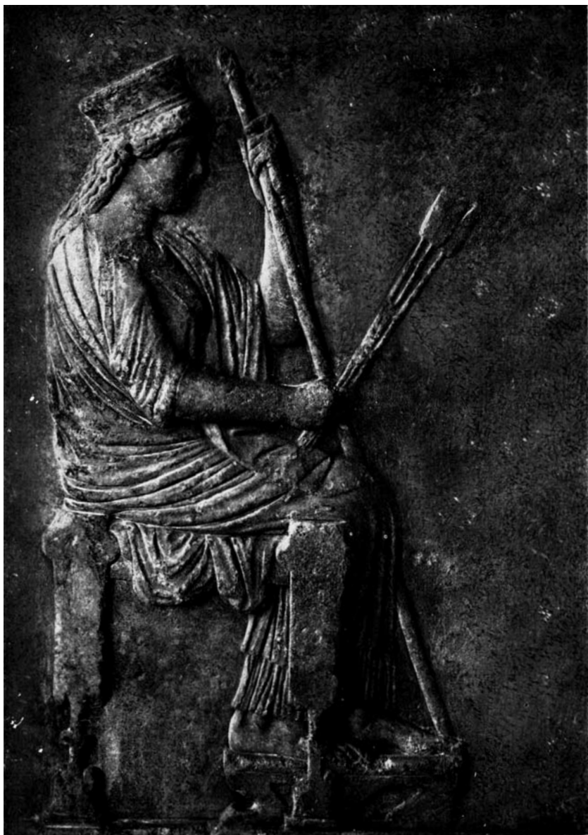
fig. 11. DEMETER (5 e eeuw v. Chr.; Eleusis , Museum