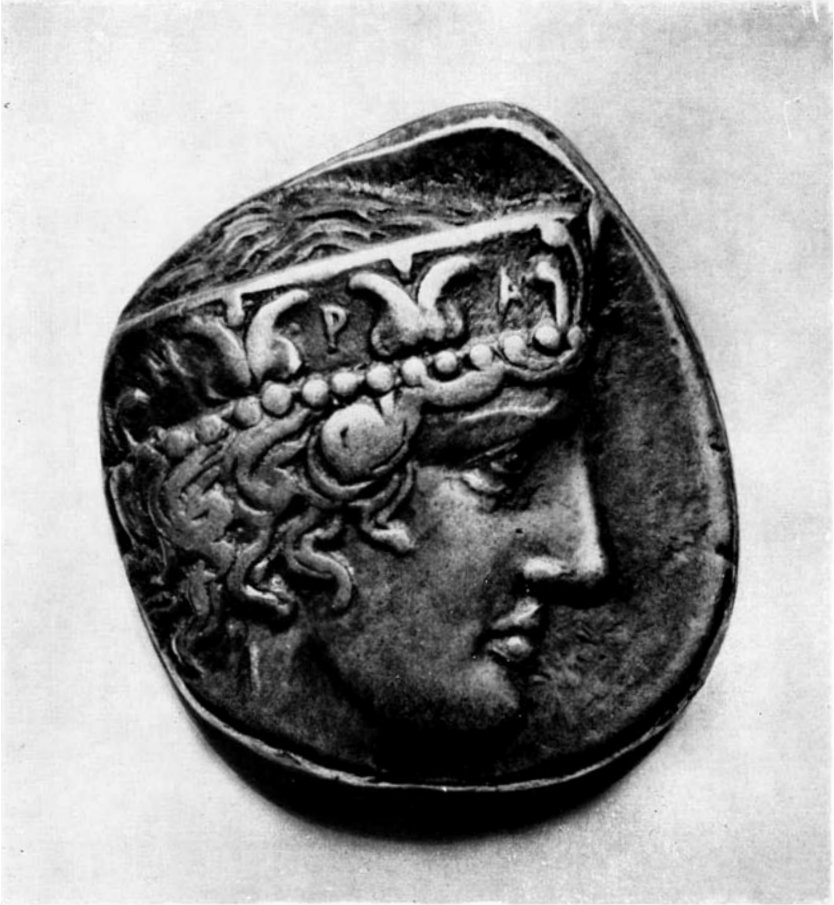
fig. 10. HERA (munt Elis, eind 5 e eeuw v. Chr.)