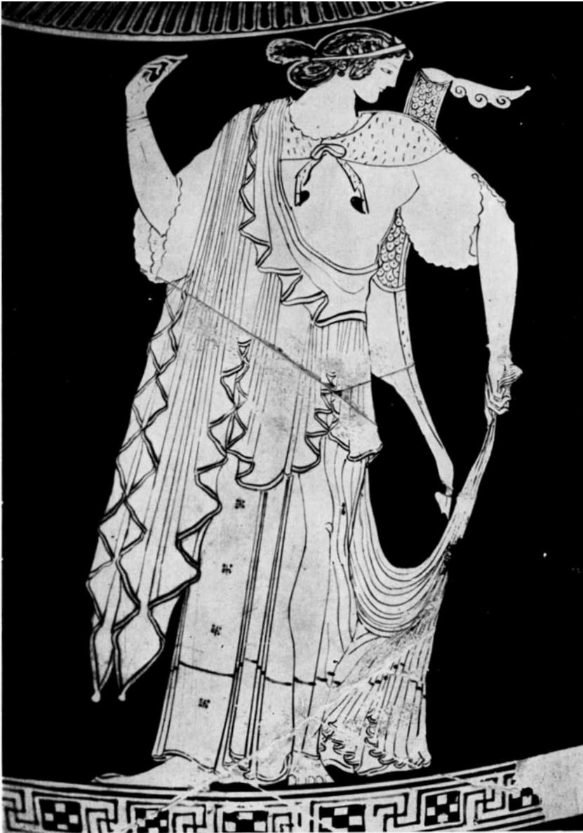
fig. 12. ARTEMIS (begin 5 e eeuw v. Chr.) München , Antikensammlungen