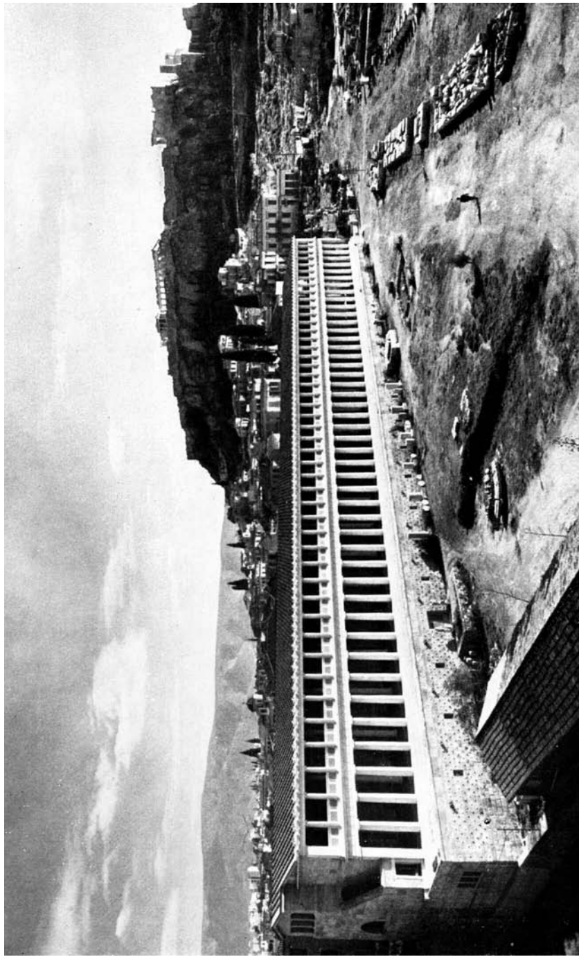
Fig. 4. De Stoa van Attalos, thans Agoramuseum.