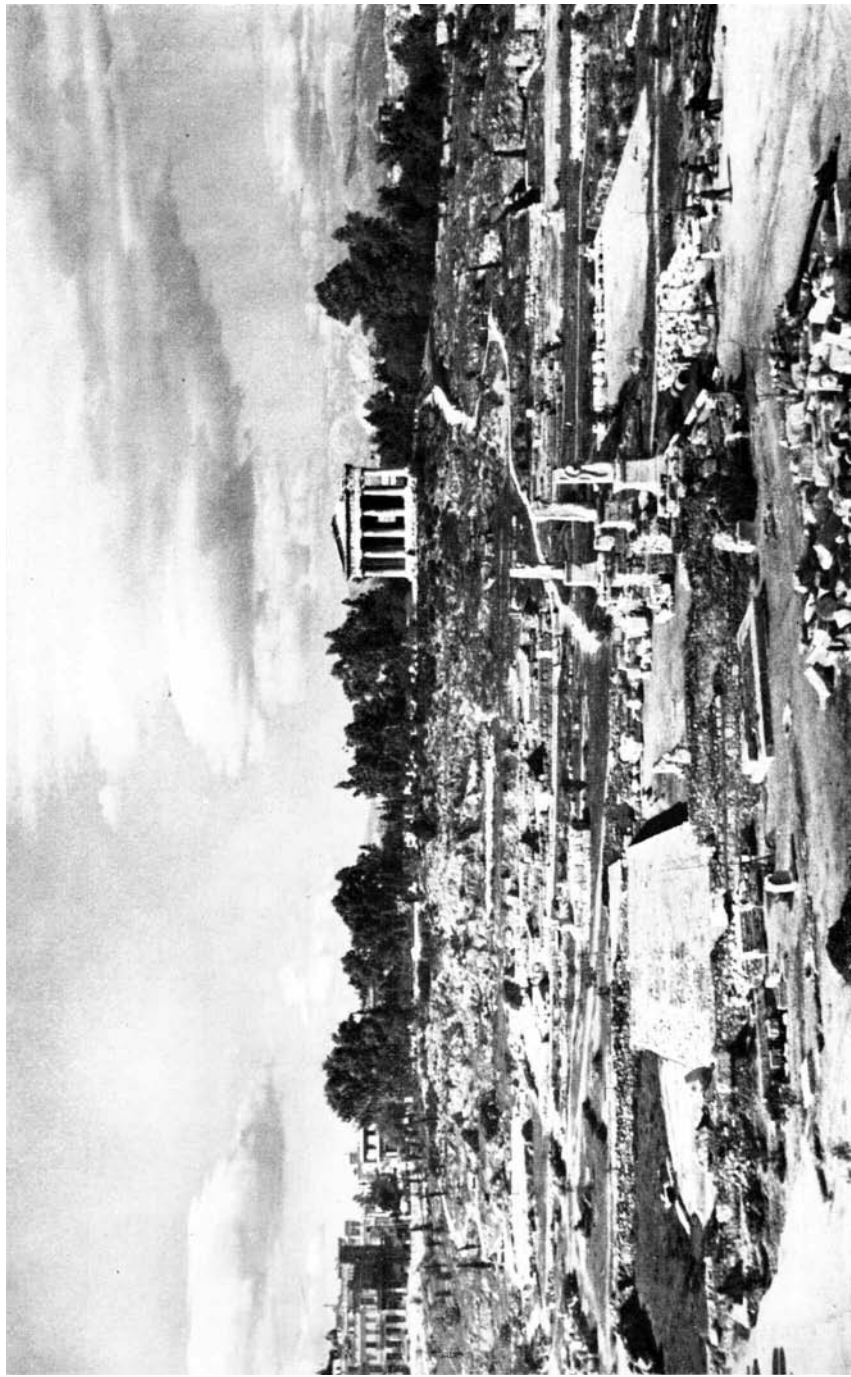
Fig. 2. Overzichtsfoto van de Atheense Agora ná de opgraving, genomen vanaf de Stoa van Attalos.